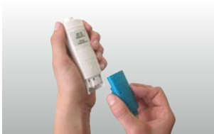
Možnost jednoduché výměny sond u testo 206-pH1/-pH2/-pH3