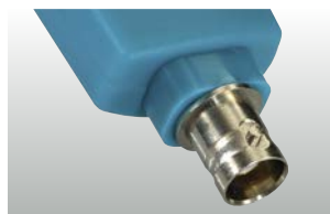
testo 206-pH3: hlavice sondy pH3 s rozhraním BNC