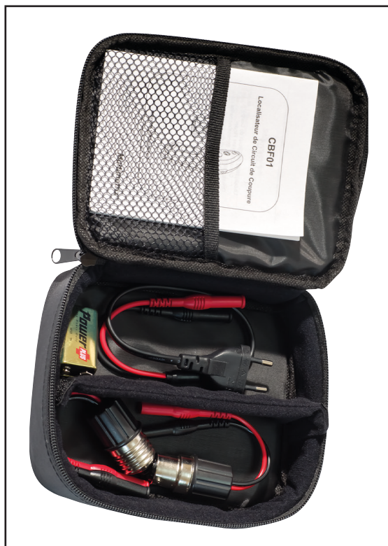
Příslušenství CBF 01