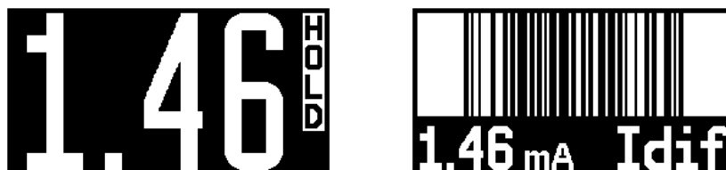
Obrázek 3: Režimy zobrazení zablokovaného údaje na displeji