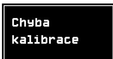
Obrázek 4: Varovné hlášení: Chyba kalibrace

Přístroj automaticky kontroluje správnost kalibračních konstant a dalších dat. Pokud dojde k jejich porušení (např. poškození paměti), zobrazí se na displeji chybové hlášení (Obrázek 4 nebo Obrázek 5) a nelze provádět měření. V tomto případě je nutné přístroj odeslat na opravu k výrobcí.