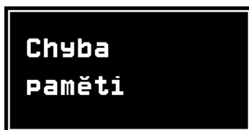
Obrázek 5: Varovné hlášení: Chyba paměti