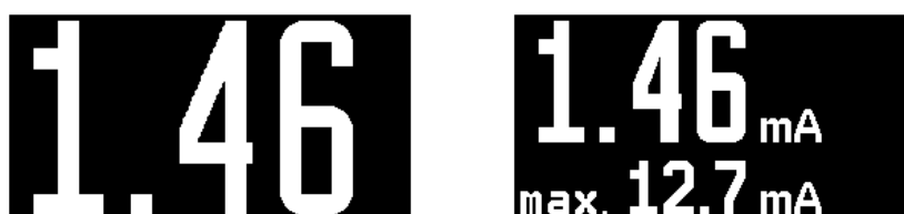
Obrázek 2: Režimy zobrazení měřené veličiny

Během probíhajícího měření se na displeji zobrazuje okamžitá hodnota měřené veličiny a případně i maximální hodnota. Volba se provádí v menu Nastavení přístroje.