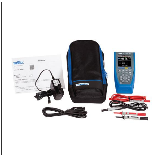
MTX 3293 – obsah dodávky